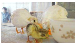
新しい命が誕生しました。

心地よい風と若葉の緑がさわやかな季節ですね。気温差がありますので体調に変化のある方は早めに職員までおねがいします。